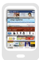
Diverse Formate auf Anfrage